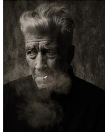
David the TM Guru

© Sandro Miller / Courtesy Gallery FIFTY ONE, Antwerp